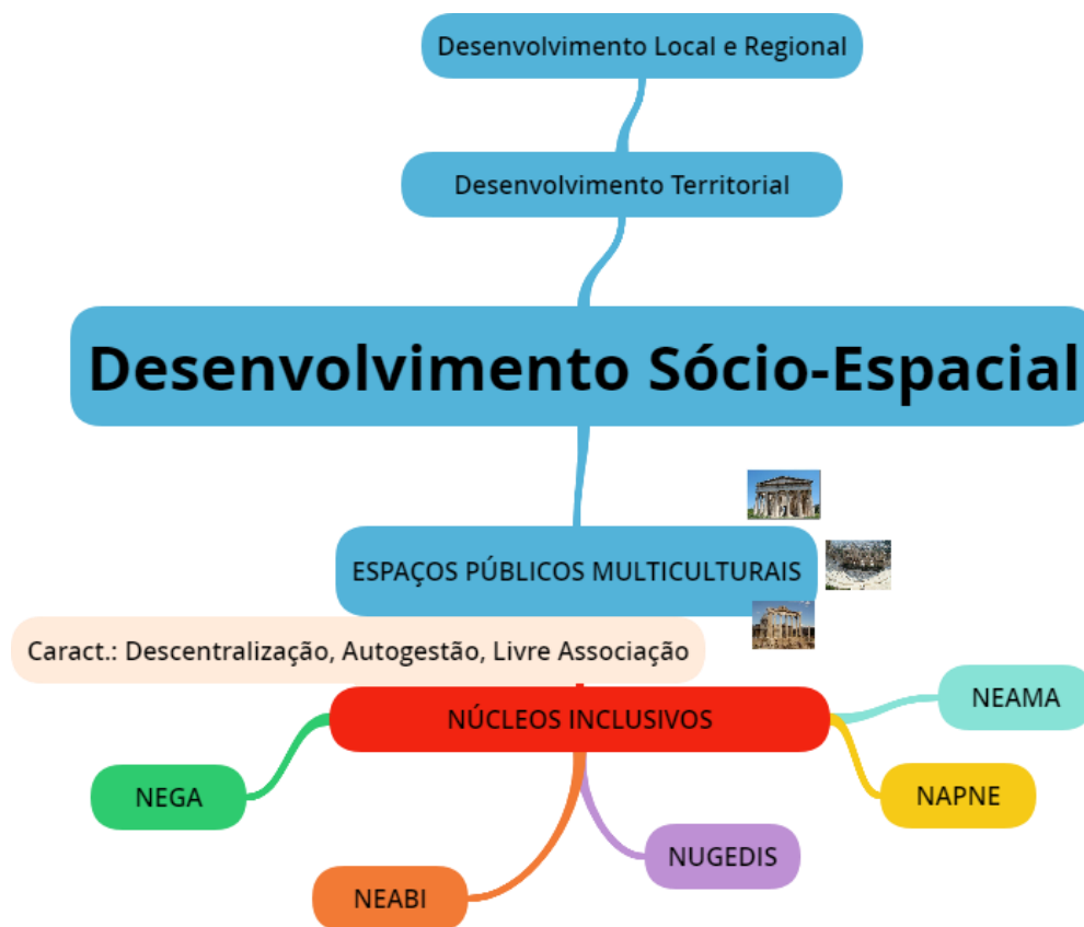
Figura 21: Esquema do Desenvolvimento Socioespacial a partir dos Núcleos Inclusivos, em sua relação com os Espaços Públicos Multiculturais

*NEGA: Núcleo de Educação e Gestão Ambiental. NEABI: Núcleo de Estudos Afro-Brasileiros e Indígenas (ou Indiodescendentes). NUGEDIS: Núcleo de Gênero e Diversidade Sexual. NAPNE: Núcleo de Atendimento às Pessoas com Necessidades Educacionais Específicas. NEAMA: Núcleo de Elaboração e Adaptação de Materiais Didático-Pedagógicos.