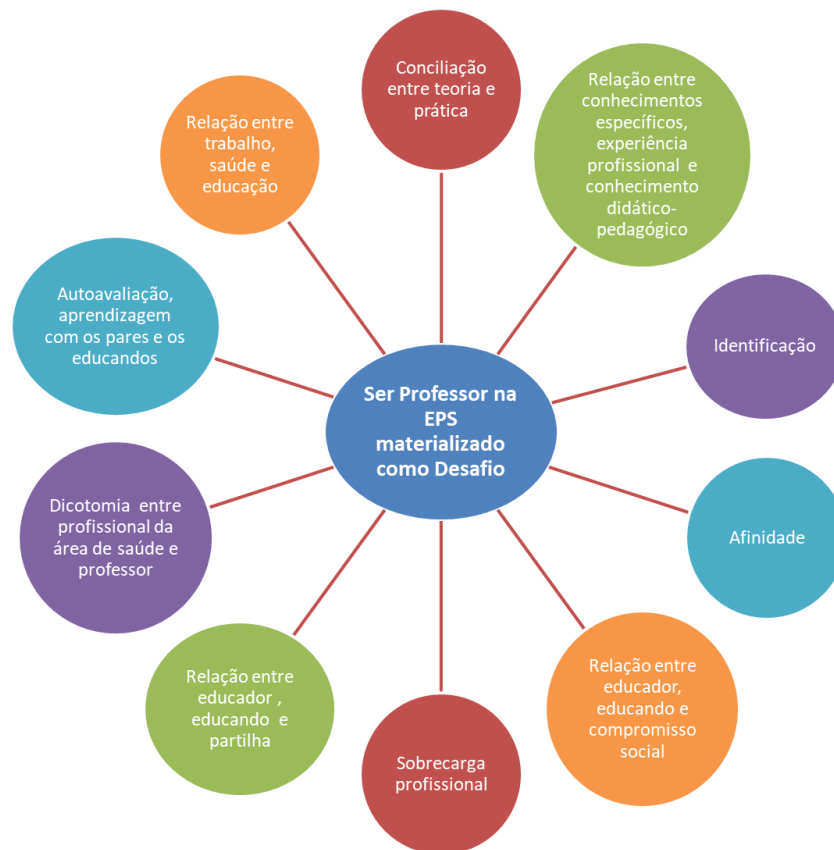
Figura 2: Conteúdos representacionais sobre o ser professor na EPS