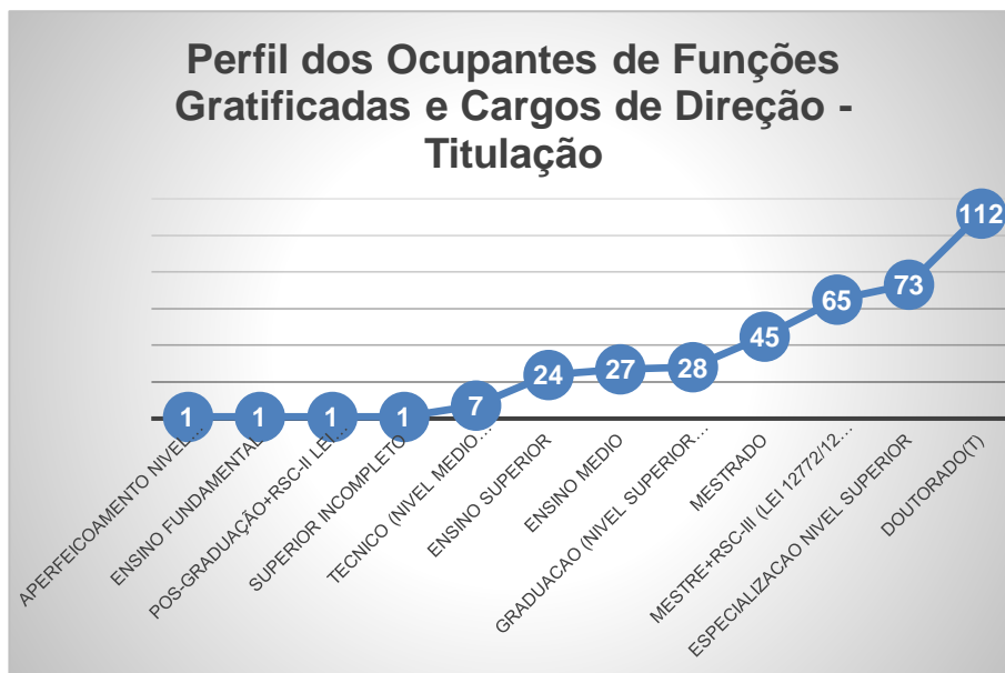
Figura 2: Perfil dos ocupantes de cargos de direção e funções gratificadas – Técnicos e Docentes – Maio/2024