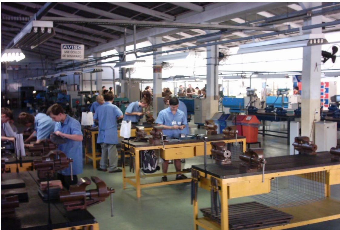
Imagem 4: Aula prática de Mecânica da Manutenção 1991

química iniciou-se 1980. Certamente, o curso de Química foi o primeiro a receber o sexo feminino entre os aprendizes. O laboratório para aulas práticas era/é amplo e moderno com boa iluminação com todo o material disponível de segurança. Assim, destacamos a evolução de uma época para outra em termos de qualidade. Na imagem 4-C temos o curso de Montagem Ferramentaria, a modernização se evidencia em um espaço maximizado e estruturado para melhor treinamento. Na aula prática, os sete meninos, todos de uniforme azul, em pé, para poder trabalhar com mais eficiência e dedicação.