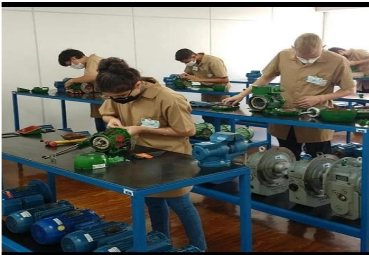
Imagem 10: Disciplina elementos de máquinas ano de 2021

Neste sentido, as imagens representadas até aqui mostram um encontro do passado com o presente e evidenciam um ensino técnico/profissional voltada para necessidade de mão de obra especializada.