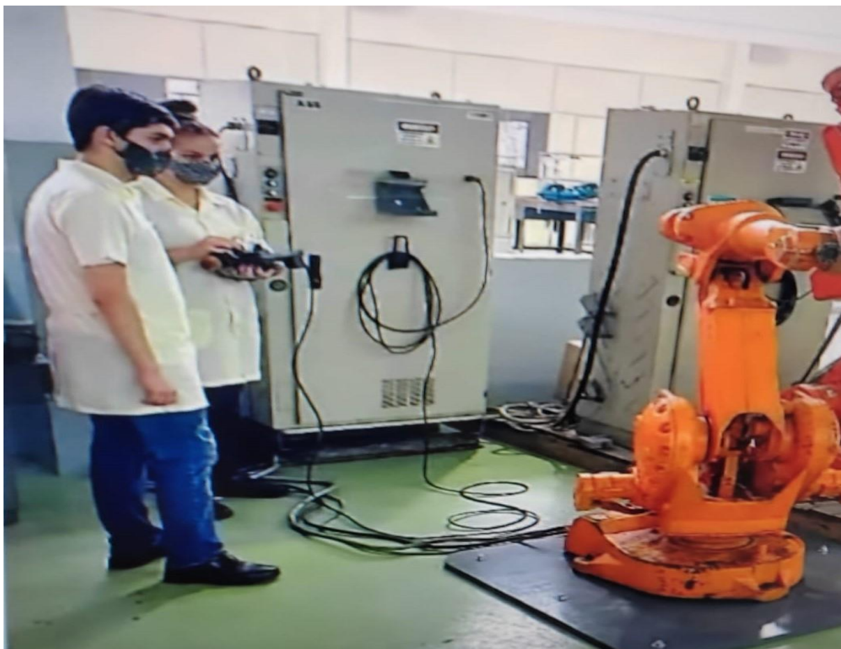
Imagem 11: Alunos de Eletrônica na disciplina de robótica industrial em 2021