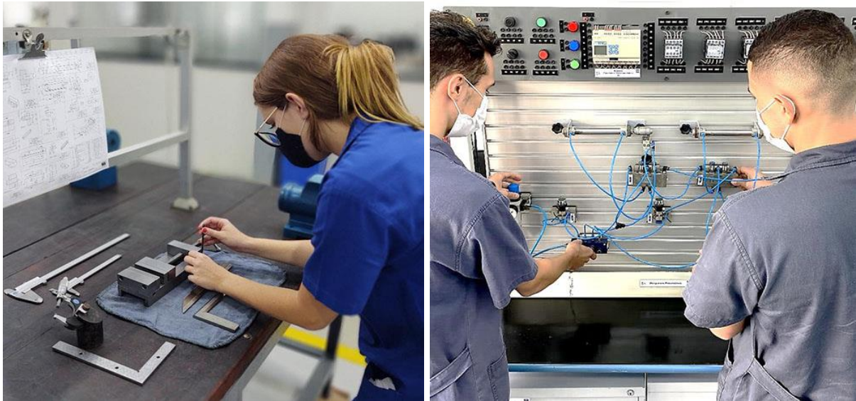
Imagem 12: Alunos em treinamento nas Bancadas didáticas em 2021