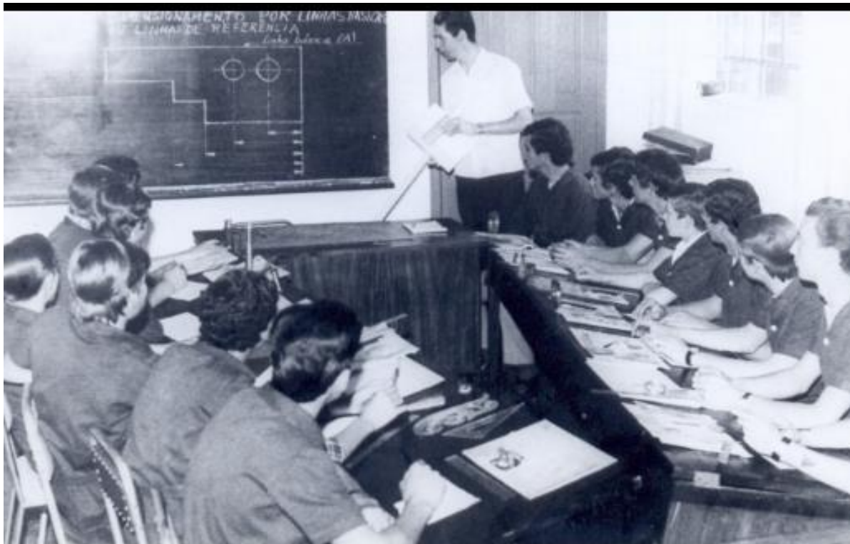
Imagem 1: Primeira turma de Ferramentaria do CentroWEG de 1968