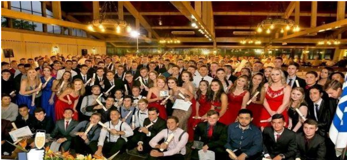
Imagem 7: Formatura do CentroWEG, ano de 2017