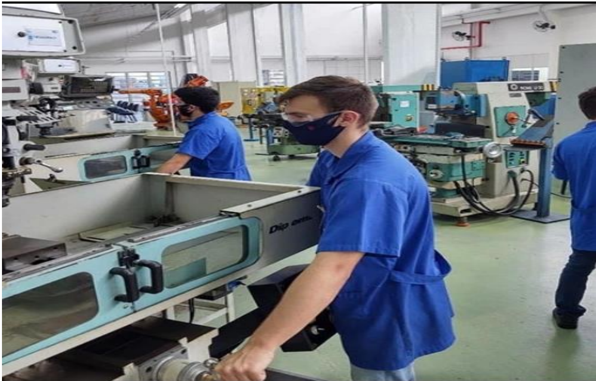
Imagem 8: Turma do Curso de Mecânica de 2021

interessantes citamos, as normas estabelecidas são as seguintes: Cumprimento às normas da empresa; respeito aos colaboradores e comprometimento com as atividades e estudos; obter 70% de aproveitamento nas disciplinas e 100% de frequência; conclusão do Ensino Médio paralelo (durante a permanência no CentroWEG o aluno deve concluir o Ensino Médio).