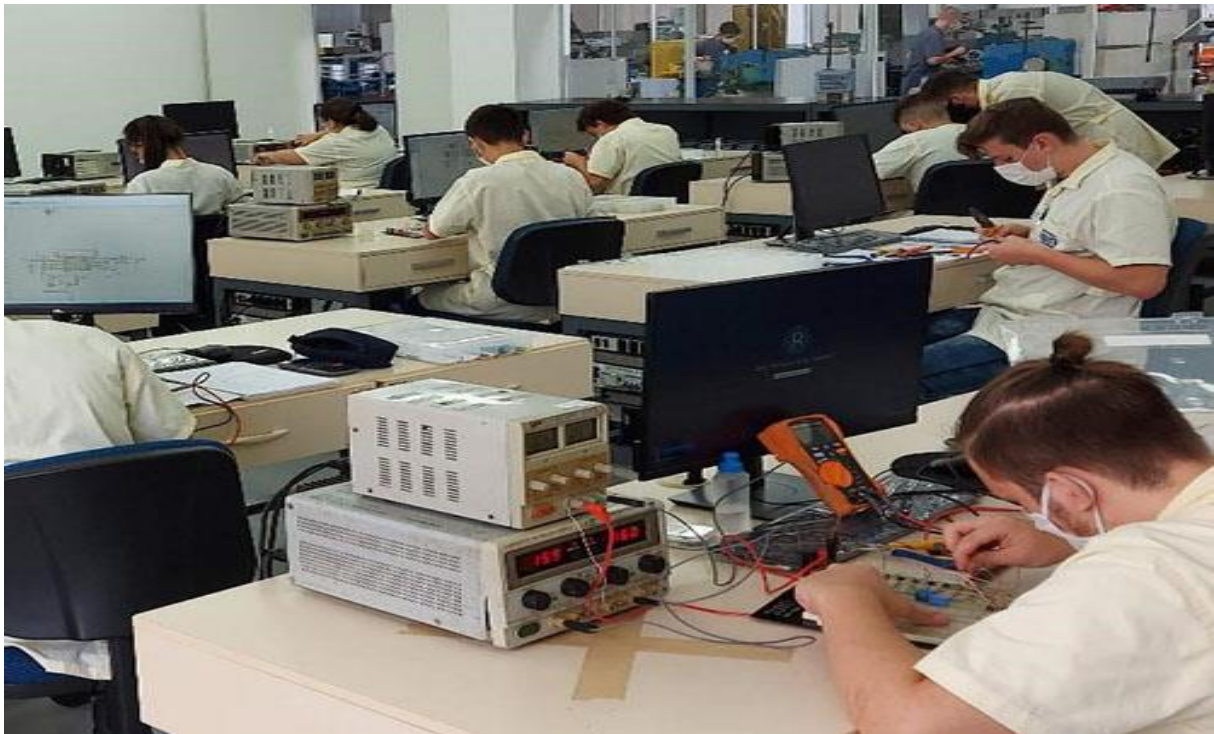
Imagem 9: Turma de eletrônica na disciplina de robótica industrial 2021

com o SENAI/SC. As imagens mostram que a instituição investiu na estrutura do centro de ensino como um todo. A modernização da indústria também abrangeu o centro de formação com a ampliação do espaço de aprendizagem para forma sua mão-de-obra.