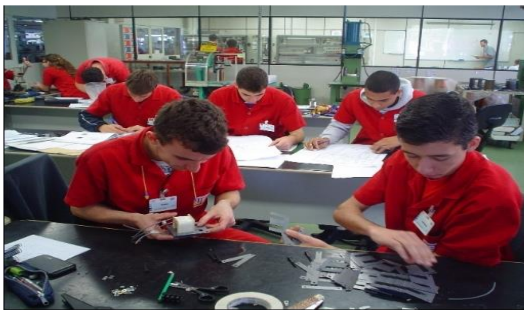
Imagem 6: Aula prática, chapa de transformadores 2012

As bancadas didáticas evidenciadas na imagem 5 trouxeram inovações no ensino técnico, pois qualificaram ainda mais a parte prática do ensino, aproximando o ensino da vivência do dia a dia do trabalho, na empresa.