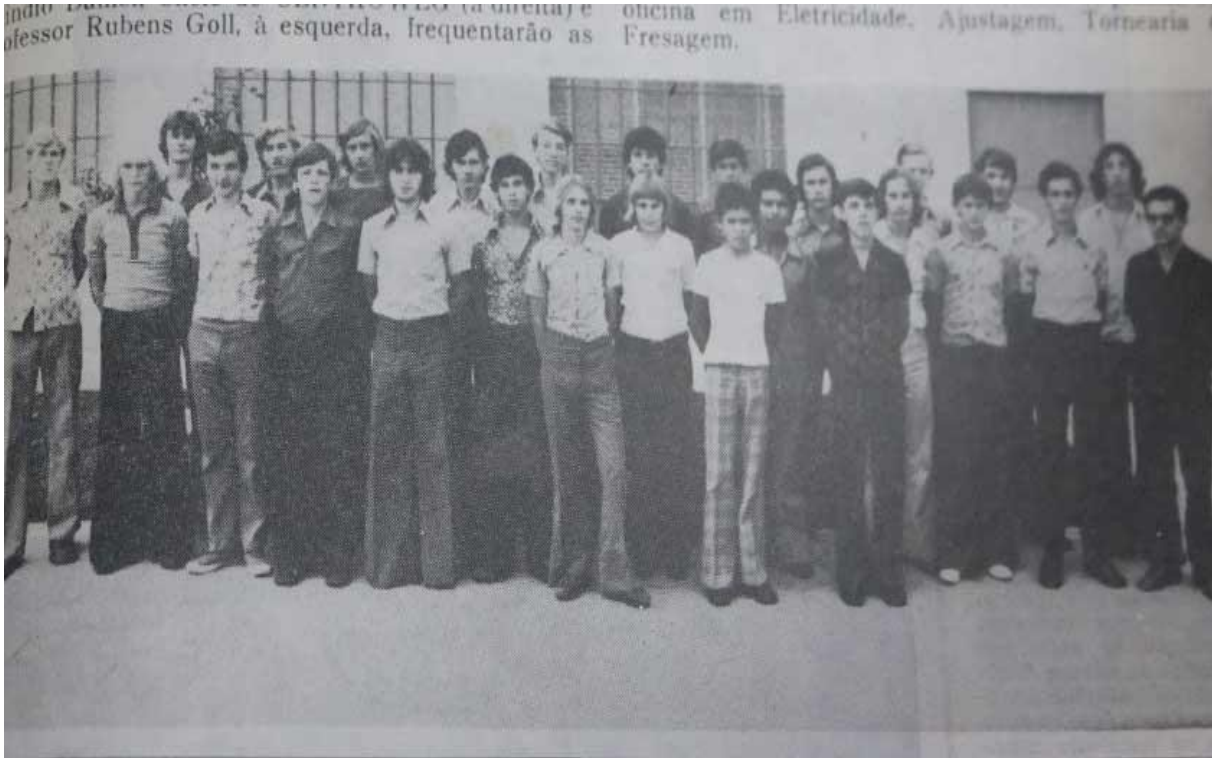
Imagem 2: Turmas de aprovados no Processo seletivo de 1970