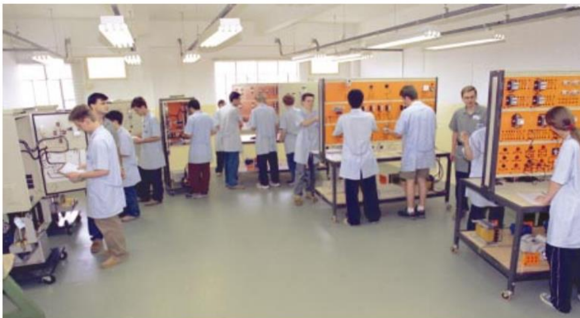
Imagem 5: Alunos praticando em bancadas didáticas em 2002.

Alunos aprendem como em uma empresa real