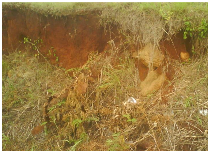
Figura 4: Pérdida de la vegetación en los alrededores de la obra.

Fundamentalmente en las obras protectoras que están paralizados e inhabitables por lo que hay permanencia de huecos y durante las etapas de preparación al terreno, transporte de la roca y la ventilación producto de la emanada de polvo que ahí se produce.