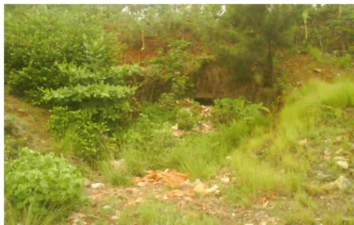
Figura 3: Pérdida y alteración de la capa del suelo fértil en el emboquille de la obra.