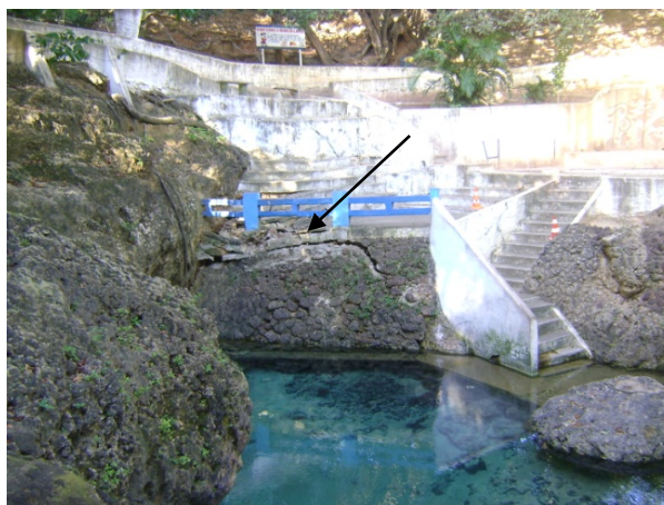
Figura 3 - Olheiro de Pureza/RN, escorregamento da barreira lateral a cabeceira.

“Essa semana a prefeita tava dizendo que parte da fonte tava interditado e que foi a bomba de água da CAERN que causou a queda da barreira.”