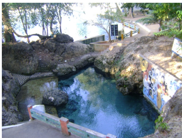
Figura 2 – Pureza/RN, fonte natural do "Olheiro" nascente do Rio Maxaranguape.

Segundo Guerra (1978), olheiro é a designação dada aos locais onde se verifica o aparecimento de uma fonte ou mina de água. As áreas onde aparecem olhos-d'água são, geralmente em terrenos rochosos, planos e brejosos.