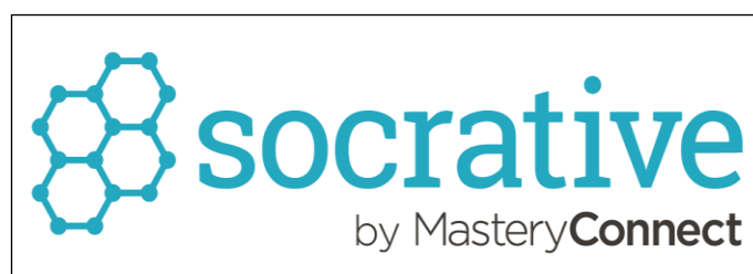
Figura 1 - Logo da plataforma Socrative.

O ambiente dinâmico, inovador e lúdico, assegurado pelo Socrative (figura 1), é um grande diferencial para o aprimoramento do ensino, visto que poderá trazer benfeitorias para a educação, conectando-a com as tecnologias, esteve presente nos objetivos dos estudiosos responsáveis pela plataforma.