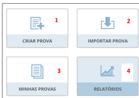
Figura 2 – Interface logado Socrative

O professor desenvolve os questionários na plataforma ( Socrative ), a liberação do acesso, podendo ser utilizado por meio de smartphones, tablets ou computadores.