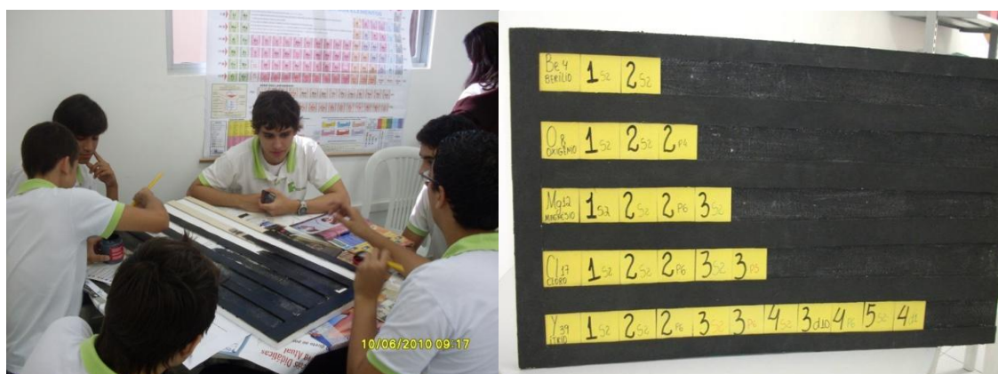
Figura 3 - Confeção do Jogo da distribuição eletrônica.

número atômicos dos elementos químicos, em outras foram colocadas à distribuição eletrônica, conforme Figura 3.