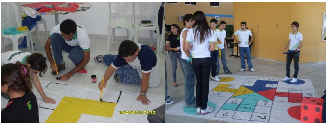
Figura 4 - Confeção do Jogo ludo atômico.

O Ludo Atômico pode ser jogado individualmente ou em grupos de até 4 participantes. Para dar início ao jogo, cada um dos participantes joga o dado e o grupo que tirar o maior número começa jogando, a partir dele a seqüência do jogo deve ser em sentido horário. Joga-se o dado e o participante caminha o número de casa definido pelo dado, se ele parar em uma em uma casa marcada com uma interrogação, terá que escolher um envelope e seguir as instruções contidas nele (responder a uma pergunta sobre os modelos atômicos, voltar uma casa, adiantar 2 casas, etc.), em seguida passará o dado para o próximo competidor que dará seqüência ao jogo. O mesmo será finalizado quando o participante/grupo percorrer todo o tabuleiro.