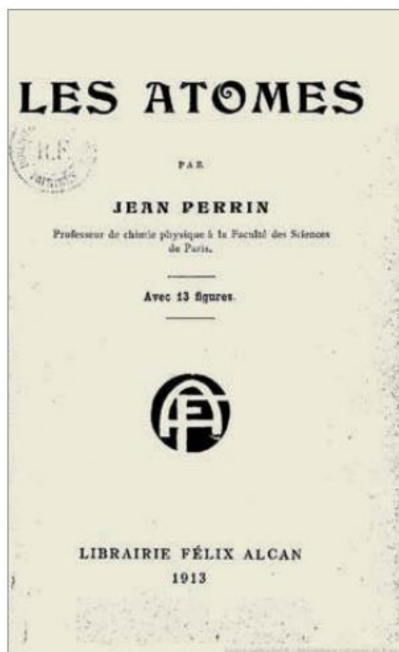
Figura 2: Imagem extraída do LDQ2.

As fontes primárias podem ser uma ferramenta para não perpetuar erros conceituais contidos em obras antecessoras, sendo uma rica forma de aproximar o aluno da história da ciência. Martins (2001) afirma a importância de se trabalhar com fontes primárias: