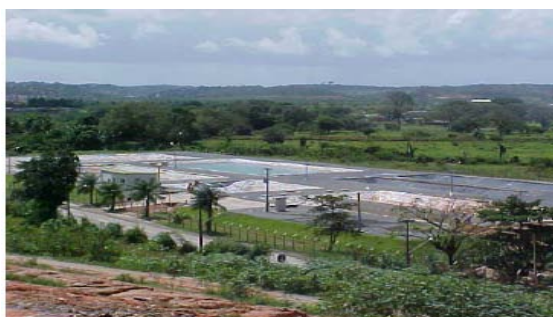
Figura 1 - Vista panorâmica

A ETP-Muribeca foi implantada em 2002, adotando um tratamento misto para o percolado do ACM, com base em dois subsistemas distintos: lagoas de estabilização (Figuras 1 e 2), e barreira reativa associada à fitorremediação.