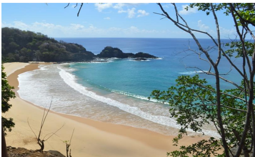
Figura 1: Vista da Praia do Sancho, Fernando de Noronha-PE.

A beleza paisagística, evidenciada na Figura 1, não é a única relíquia encontrada no arquipélago. Pois, a diversidade de formas de vida ali existente interage de maneira singular, para formar um verdadeiro paraíso sob a face da Terra.