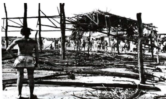
Figura 6 | Acampamento Escolar queimado

A cidade de Natal, como parte da Federação Brasileira, passou a ser governada pelas Forças Armadas que exercia todo o poder numa versão ainda mais centralizadora e autoritária, pois que aquela situação não representava a vontade individual ou de um grande número de pessoas, nem estavam eles autorizados a realizarem ações em nome deles. Esse quadro não respeitava a vontade daqueles que aqui moravam, nem estavam interessados em pactos com a população, seus desejos, objetivos, vontades ou necessidades. Algo diferente e sombrio se espriava por aquele litoral que estava a experimentar outra perspectiva social de gestão e educação municipal. E todas as ações foram virando poeira da história na medida em que seus membros eram exilados e seus projetos queimados.