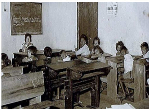
Figura 1: Sala de Aula da Escolinha

As Escolas Municipais, na forma da Lei, receberam o nome de Escolinhas , implantadas como medida de curto prazo, com o objetivo de diminuir os altos índices de analfabetismo. A Figura 1 nos permite conhecer uma sala de aula das Escolinhas