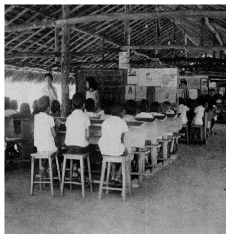
Figura 4 | Acampamento Escolar/Rocas