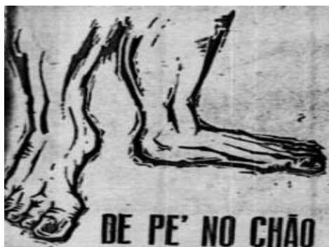
Figura 2: Símbolo da Campanha