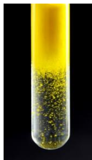
Figura 1: Reação de precipitação do iodeto de chumbo