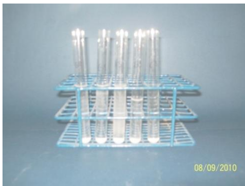
Figura 2: Reações químicas de carbonato de sódio e cloreto de cálcio em volumes diferentes