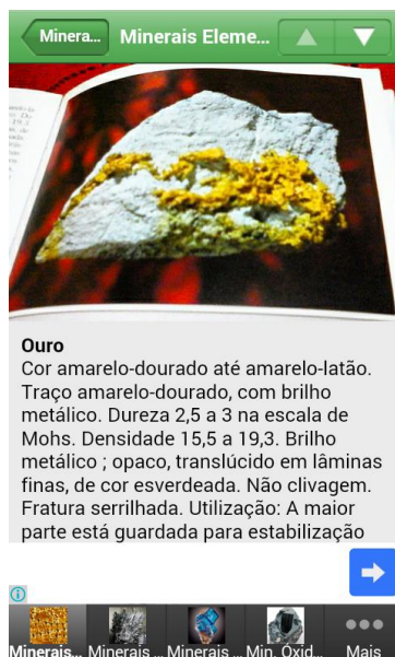
Figura 3: Interface de resultado final da busca, na opção ouro.

Assim vemos que o uso correto do aplicativo BuscaMin é simples e disponível para todos, não exigindo habilidades técnicas ou conhecimentos específicos para sua plena utilização.