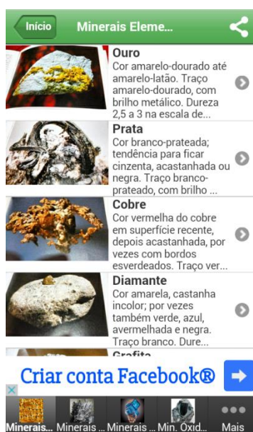
Figura 2: Opção de minerais elementos selecionada.

Dando prosseguimento, ao selecionar uma das opções da interface inicial, abrirá a lista de minerais correspondentes ao grupo, como vemos na Figura 2, onde a opção de minerais elementos está sendo exemplificada como seção selecionada.