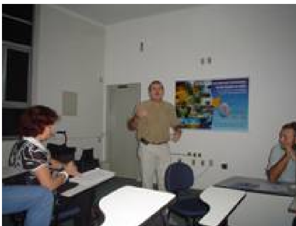
Figura 10: Correspondência eletrônica interna: impacto na produtividade