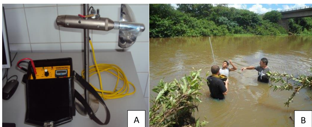
Figura 2: A. Molinete fluviométrico. B. Determinação da velocidade do fluxo de água no rio Piranhas, Pombal-PB (2012).

Na secção de controle da bacia foram realizadas no período de 06/03/2012 a 22/06/2012 oito medições da descarga líquida e de sedimentos de fundo. A vazão foi determinada através do método velocidade-área da meia seção, em que a velocidade de fluxo foi medida através de molinete fluviométrico com contador eletrônico de pulso (Figura 2) e através de medidor acústico Doppler de vazão, usando o ADP RiverSurveur S5 da Sontek.