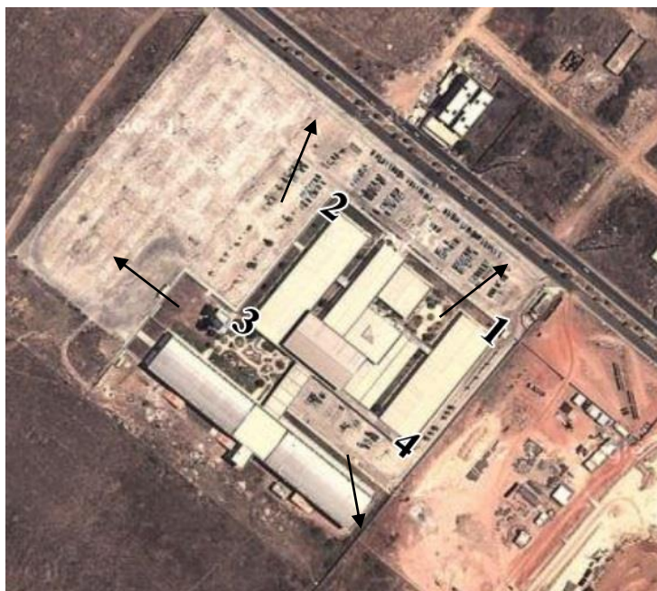
Figura 2: Vértices e direções da coleta dos dados da Universidade, campus Mossoró-RN.