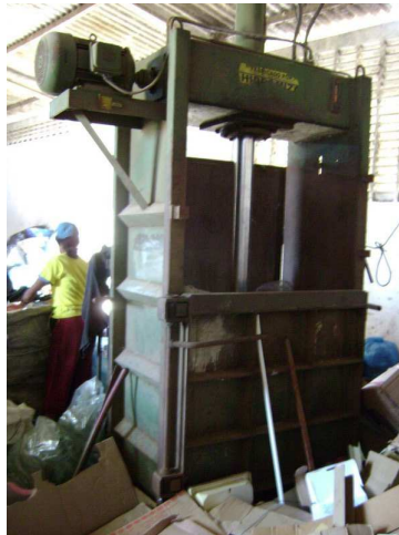
Figura 3: Prensa da ASCAMAR.

A falta de equipamento necessário para uma melhor realização do trabalho é, também, um grande problema. Atualmente as associações vendem o material recolhido para terceiros. De acordo com o tesoureiro da ASTRAS, a associação prosperaria se eles possuísem uma prensa de papel, como a encontrada na ASCAMAR (Figura 3), pois dessa forma o material prensado poderia ser vendido diretamente para as indústrias, inclusive de outras cidades, como Recife, a um preço em média cinco vezes maior do que o atual.