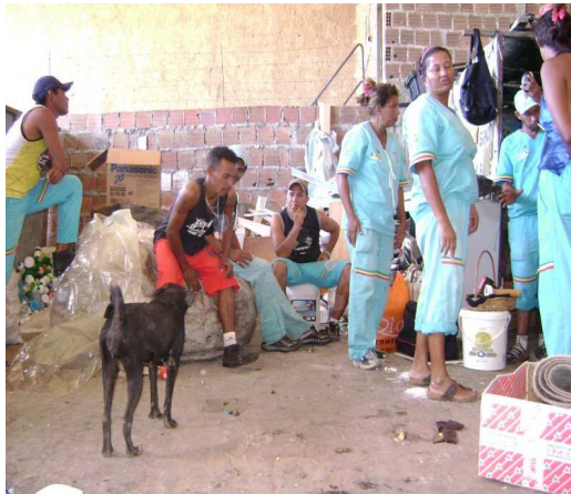
Figura 4: Presença de macrovetor e a falta de EPIs para os trabalhadores.

Outro aspecto verificado diz respeito aos resíduos sólidos. De acordo com as informações obtidas durante a visita técnica, as características do material coletado mudam de acordo com o aumento do poder aquisitivo de cada bairro: quanto mais rica a área, maior o consumo, maior a quantidade de lixo, melhores são as suas condições e maior o valor comercial de revenda que ele apresenta, o que nos permite verificar as enormes desigualdades existentes em nossa sociedade atual.