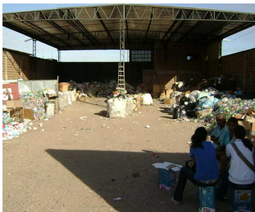
Figura 2: Vista exterior da ASCRN.

Na ASCRN, uma parte do depósito é a céu aberto, como mostra a Figura 2. Sendo assim, o trabalho no local fica impossibilitado de continuar quando chove.