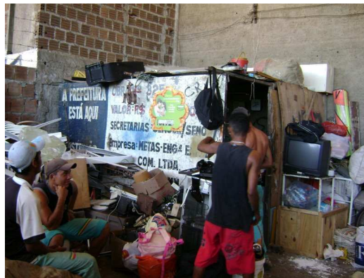
Figura 5: Escritório improvisado pelos associados.

Uma situação incomum ocorreu durante a visita à ABRESOL, que demonstrou muita resistência em explicar sua localização e fornecer alguns dados para a pesquisa.