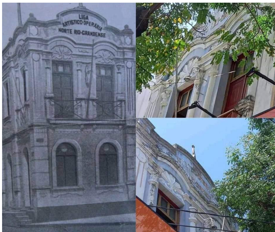
Figura 3: montaje con imágenes de la sede de la Liga Artístico-Operária Norte-Rio-Grandense. A la izquierda, el edificio a principios del siglo XX; a la derecha, el edificio actual, aún en pie, en la Avenida Rio Branco.

las principales arterias de la ciudad, la Avenida Rio Branco, indicaba que la Liga gozaba de prestigio en la sociedad natalense (Figura 3).