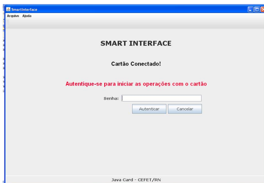
Figura 1 - Smart Interface - Tela de Autenticação

A tela de autenticação é a tela inicial do programa e é mostrada quando um cartão é detectado. Através dela o desenvolvedor pode autenticar-se e iniciar as operações com o cartão. Essa tela possui dois botões, “Autenticar” e “Cancelar”. O botão “Autenticar” dispara um evento que executa o comando AUTH do SMART SHELL com algumas adaptações. O botão “Cancelar” dispara um evento que fecha a tela e ignora a presença do cartão. A tela de autenticação é mostrada a seguir: