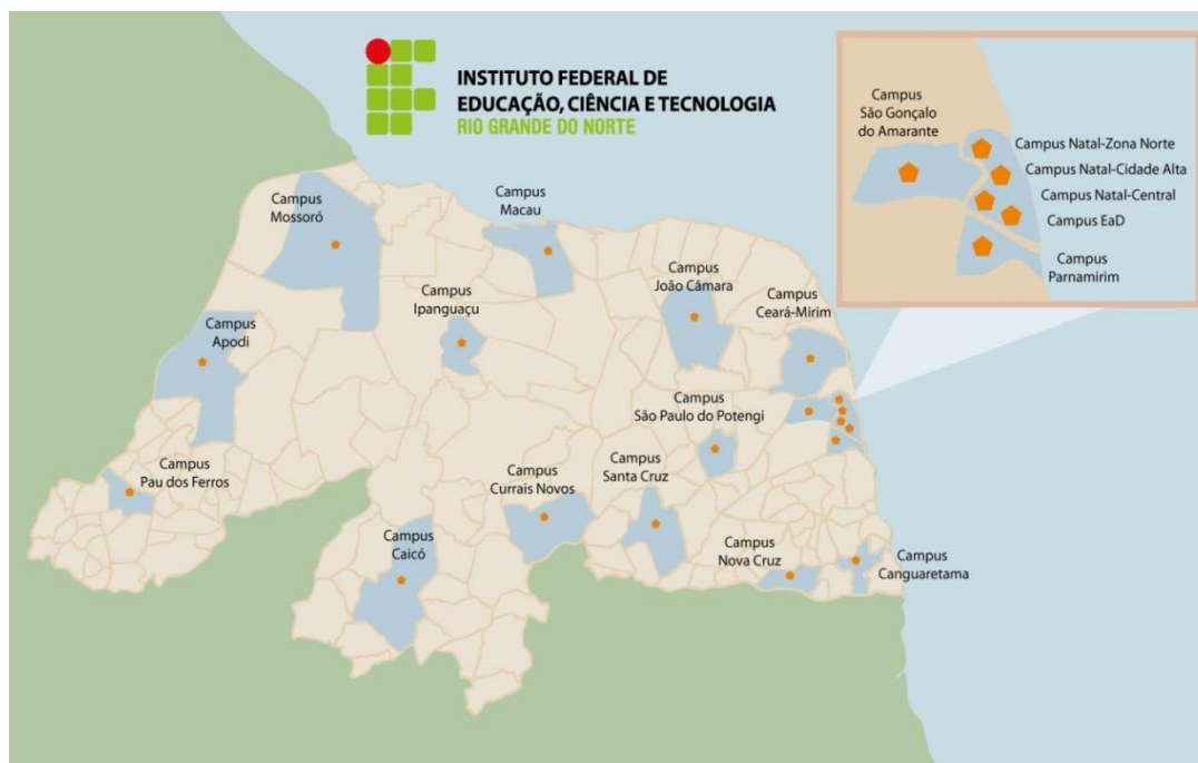
Figura 4 – Distribuição geográfica dos campi do IFRN no Rio Grande do Norte

Com base na figura a cima pode-se perceber que todas as mesorregiões potiguares estão atendidas com a distribuição territorial dos Institutos Federais, advindos da expansão da rede federal de educação tecnológica. Uma nova expansão está sendo elaborada no Rio Grande do Norte, e inicia-se em 2013 com a autorização para a implementação de dois novos Campi: Parelhas e Lajes (este encontra-se no mapa no ponto mais vazio, ou seja a região central do Estado). Outro ponto que é importante salientar é o modelo de expansão que ao nosso ver segue a linha das regiões de influência das cidades do IBGE, onde, de certa forma, todos os Institutos do estado se interligam ao Campus Natal Central em uma rede de qualificação profissional. Segundo dados do SISTEC (2012), no mês de junho os IF's possuíam 33.678 alunos matriculados em todo o estado, representando assim, um total de 18,75% das matrículas de nível médio, profissionalizante e EJA (nível médio) no estado, que tem, de acordo com dados do Censo Escolar (2011), um total de 179.584 alunos matriculados nas categorias citadas anteriormente.