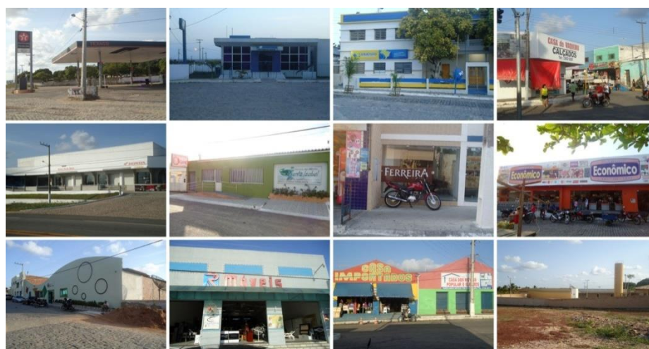
Figura 3 - Variedade de comércios e serviços na cidade polo de João Câmara