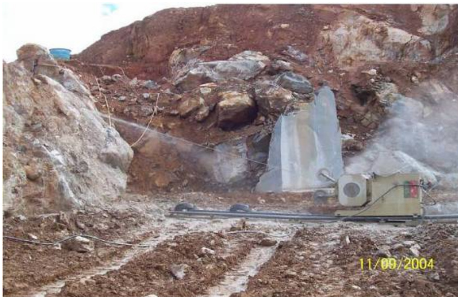
Figura 4 – Corte vertical com fio diamantado (Almeida, 2006).