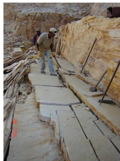
Figura 1 - Frente de lavra e remoção das placas de quartzito foliado – Alpinópolis / MG (Valadão et al, 2010).