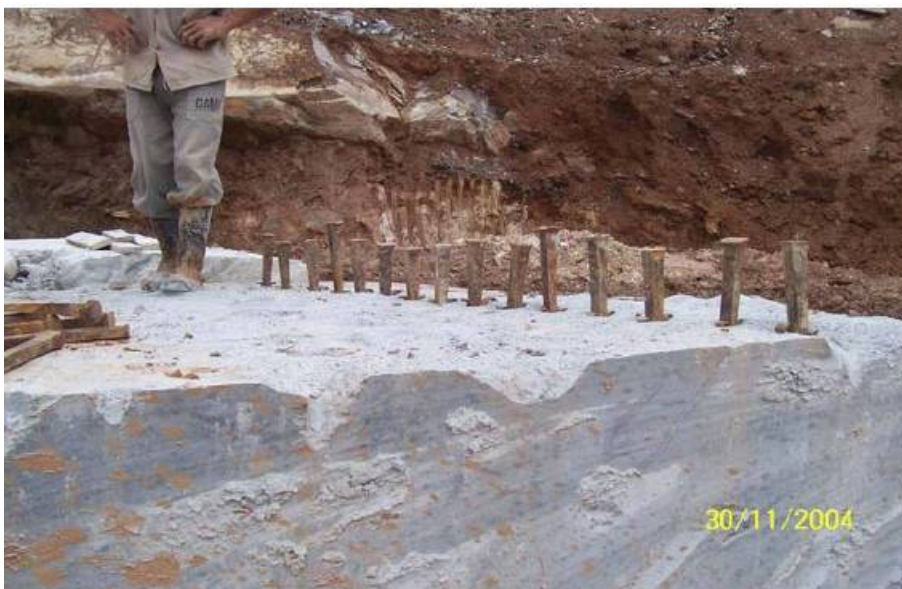
Figura 5 – Furos com cunhas metálicas (Almeida, 2006).