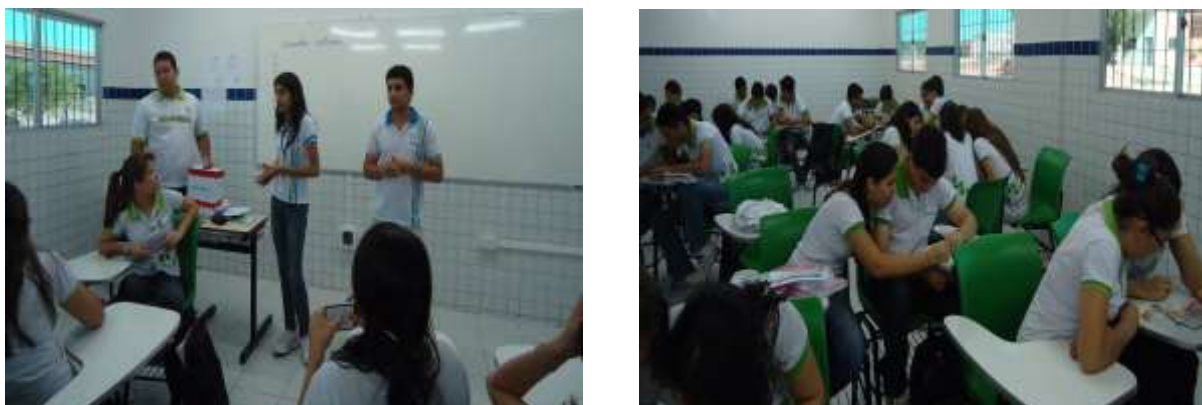
Figura 4: Explicação e aplicação do Bingo Químico

Após a aplicação do jogo foi feito outro teste de sondagem. Ao comparar os resultados obtidos nesse teste com o primeiro pôde-se perceber que o jogo ajudou a melhorar o desempenho dos alunos com relação ao conhecimento sobre a nomenclatura dos compostos químicos como pode ser observado na Tabela 1.