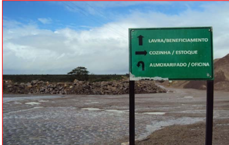
Figura 4 - Placas de sinalização na pedreira.

Outra política de prevenção contra acidentes no trabalho adotada pela empresa é o DDS matinal, também conhecido como minuto da segurança, que consiste em uma mini-palestra de aproximadamente 10 minutos de duração que ocorre diariamente na pedreira, abordando tanto fatores relacionados a segurança no trabalho quanto a segurança fora do trabalho.