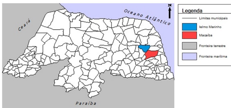
Figura 1- Mapa de Localização

A unidade Macaíba ocupa atualmente parte do espaço antes destinado a Pedreira Potiguar, pois a transição entre as duas empresas, iniciada em Abril de 2010, ainda está em andamento. Em Maio de 2010 a Votorantim Cimentos assumiu a produção no local, estimando-se um rendimento