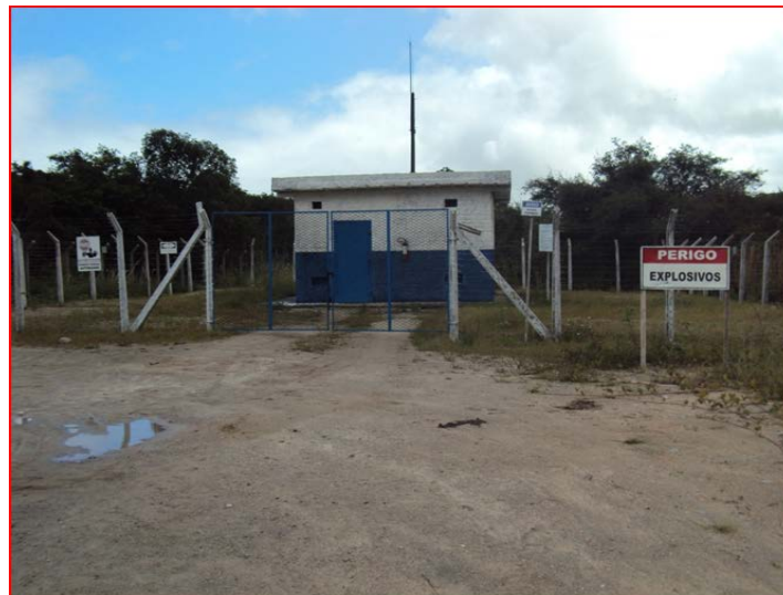
Figura 2 - Paiol de explosivos da Pedreira

Porém é importante destacar algumas medidas que a empresa deve tomar em relação aos seus paióis, locais onde são armazenados os explosivos e os acessórios dentro da mina, cada um em seu paiól específico (nunca deve-se manter em um mesmo ambiente explosivos e acessórios). Como estamos nos tratando de materiais perigosos, é importante que os paióis sigam o modelo padrão de segurança estabelecido pelo Exército , atitude que reduz as chances de acidente.