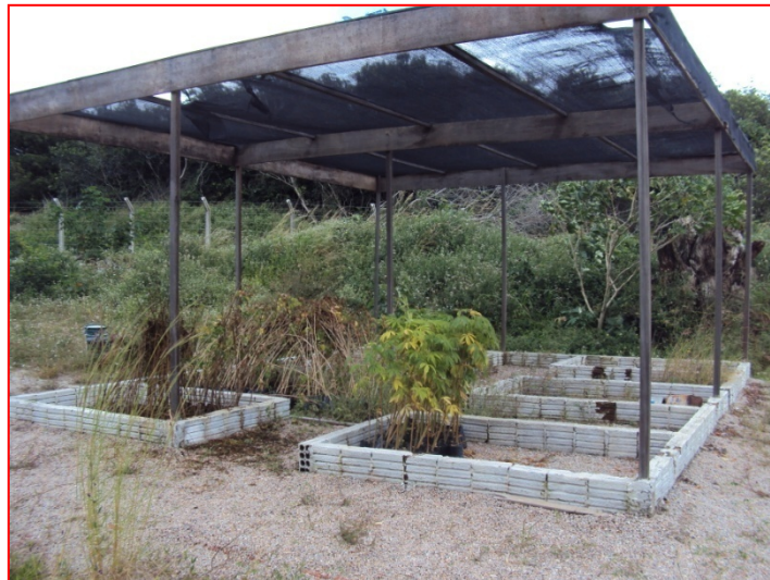
Figura 3 - Viveiro próprio da pedreira

Outro ponto positivo a se destacar quanto á questão ambiental é o cultivo de mudas nativas da região em um viveiro próprio da empresa, que serão utilizadas em um posterior replantio da área.