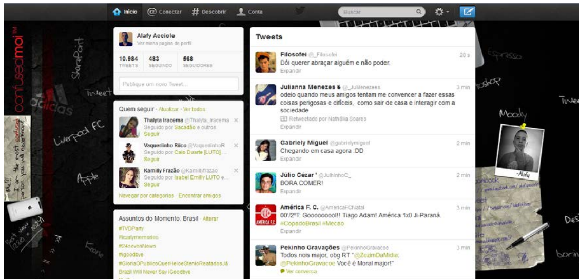
Figura 2: Twitter um mundo de novidades.

As atualizações são exibidas no perfil de um usuário em tempo real e também enviadas a outros usuários seguidores que tenham assinado para recebê-las. No twitter existem quatro funções importantes que atraem o seu público: