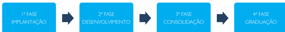
Figura 1 - Fases de Incubação

A metodologia de incubação será baseada no Modelo CERNE (Saiba mais em: http://anprotec.org.br/cerne/ ) de gestão e consistirá nas seguintes fases, conforme a Figura 1.