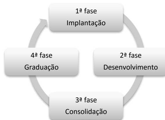
Figura 1 - Fases de Incubação

3.1. A metodologia de incubação será baseada no Modelo CERNE de gestão e consistirá nas seguintes fases, conforme a Figura 1: