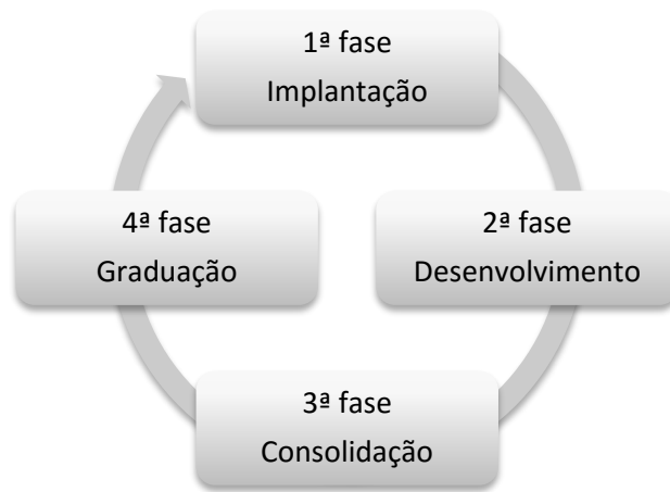
Figura 1 - Fases de Incubação